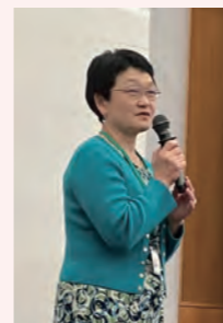
お礼の言葉： 祖父江副部会長