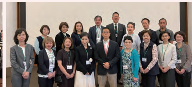
スタッフの皆様お疲れさまでした