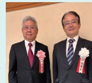
湯下名古屋国税局長と▶