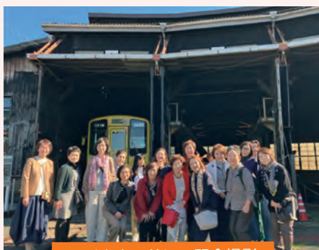
扇形車庫の前にて記念撮影