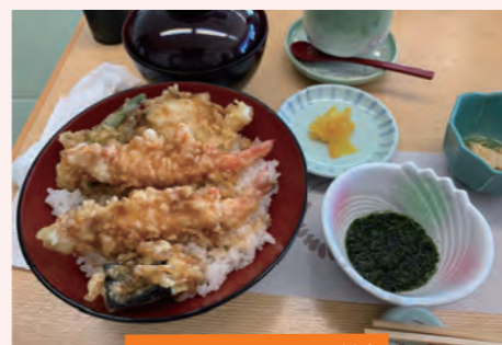
魚あら名物「活天丼」